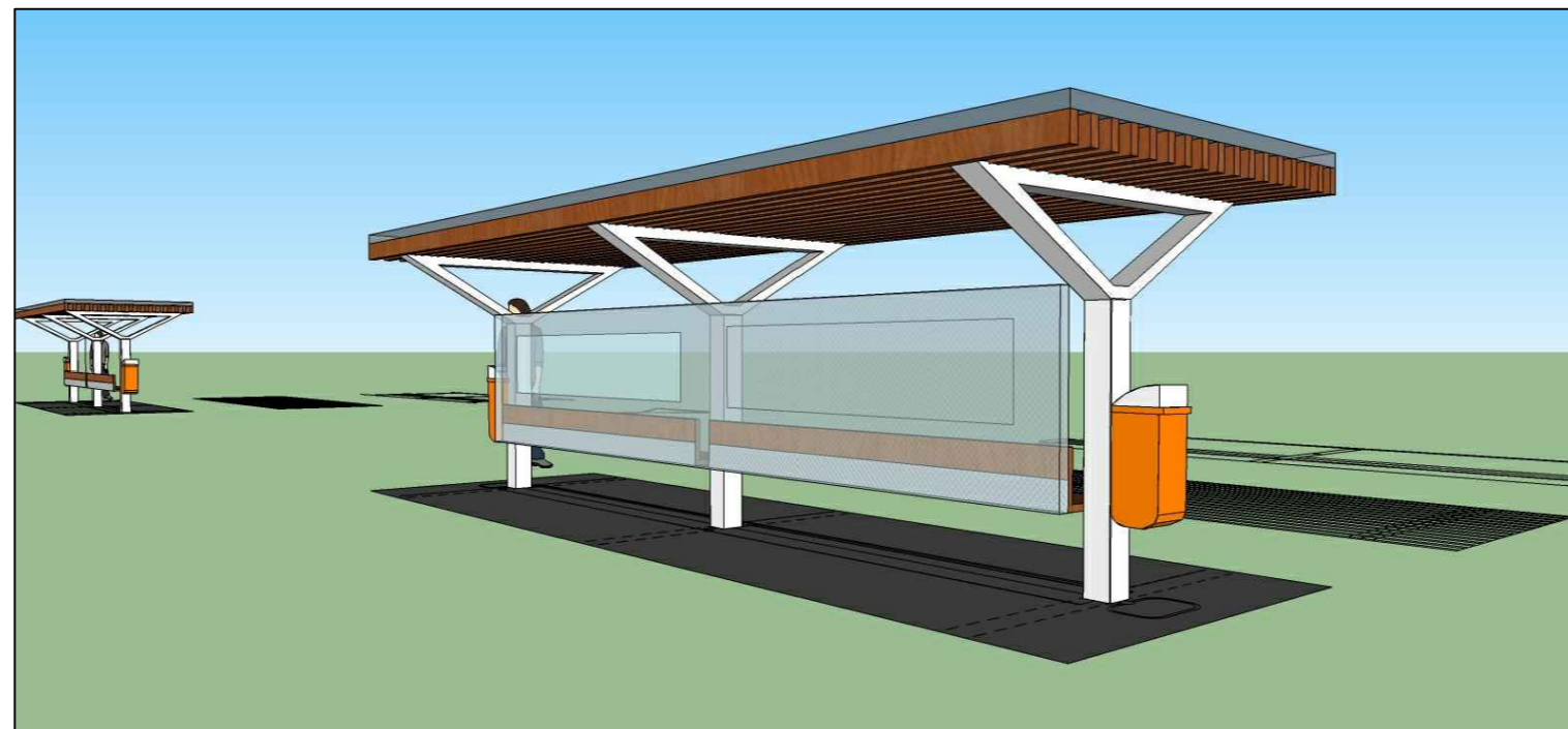
PERSPECTIVA VISÃO FUNDOS