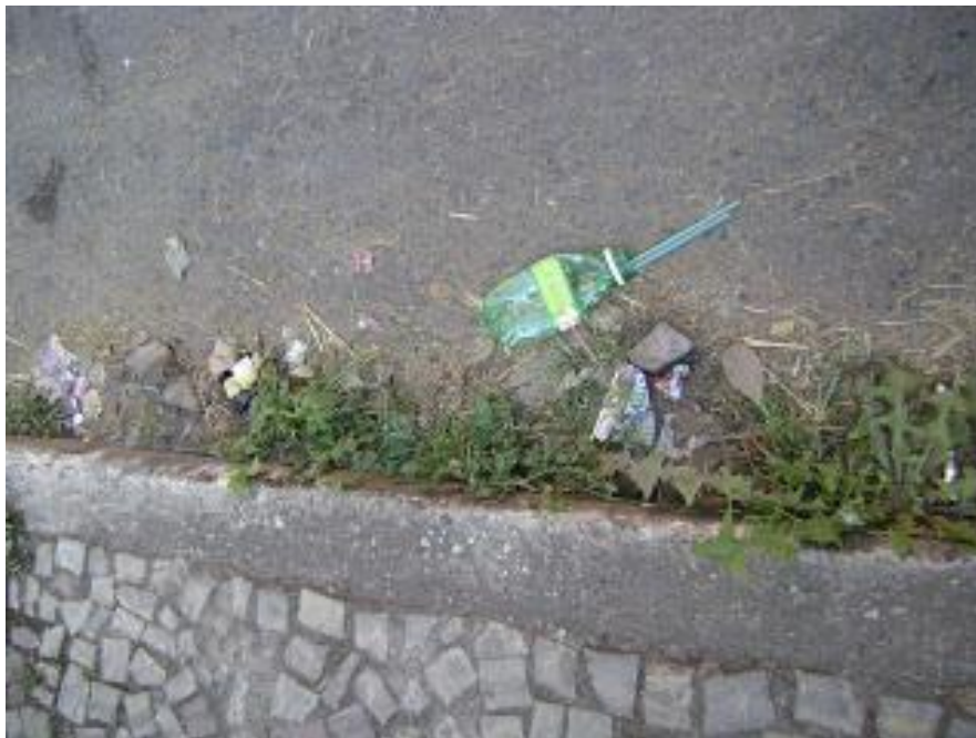
Exemplo de sarjeta necessitando de capinação e raspagem de terra

Sendo assim, a necessidade mínima mensal para execução da capinação será de 63.386,40 \text{ m}^2 / 2.365,00 \text{ m}^2 = 27 (vinte e sete) garis.