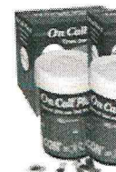
150 Tiras para On Call Plus 2