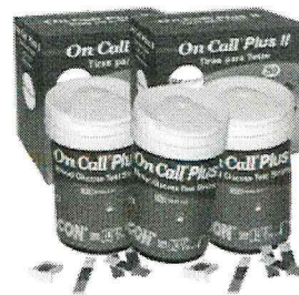
150 Tiras para Medição de Glicose ( 3 TIURFTES ) - On Call Plus 2