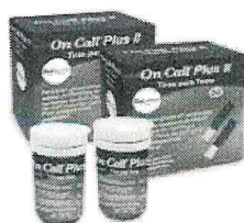
100 Tiras para Medição de Glicose ( 2 TIURFTES ) - On Call Plus 2