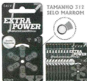
Pilha Auditiva 312 com 60 unidades - Extra Power