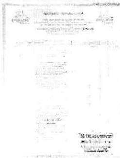
PRESIDENTE KENNEDY.jpg 189K

-- IMIGRANTE TRATORES LTDA ME Av.Evandi Américo Comarela,1253, Marmim,Venda Nova do Imigrante-ES FONE: (28) 3546 3481 www.imigrantetratores.com.br imigrantetratores@gmail.com