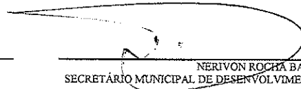
NERIVON ROCHA BAYERL SECRETÁRIO MUNICIPAL DE DESENVOLVIMENTO DA AGRICULTURA E PESCA