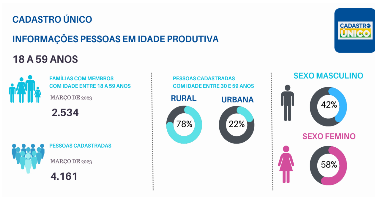
Figura 2: Informações do público em idade produtiva.