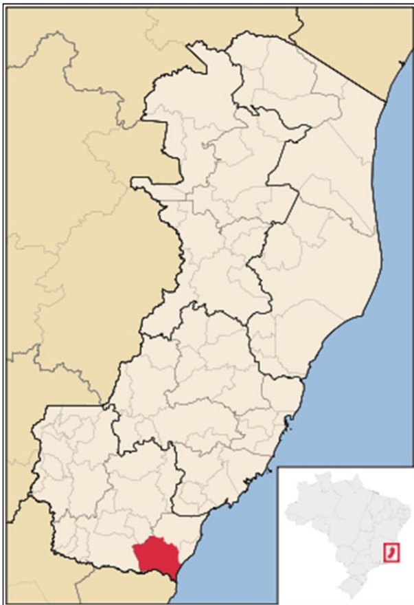
Figura 1- Mapa do estado do Espírito Santo, com destaque para o município de Presidente Kennedy

O município de Presidente Kennedy está localizado no extremo sul do estado do Espírito Santo, com uma latitude de 21°05'56" sul e a uma longitude 41°02'48" oeste estando a uma altitude em média de 55 metros em relação ao nível do mar. Sua população estimada pelo Instituto Brasileiro de Geografia e Estatística (IBGE) é de 11 221 habitantes, possui uma área de 583,933 km 2 . O presente projeto tem como objetivo descrever e quantificar uma série de atividades necessárias para manter a cidade limpa, e assim, eliminar possíveis focos transmissores de doenças e, ao mesmo tempo, preservar o meio ambiente e a qualidade de vida da população.